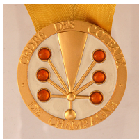
Dame Officier Officier