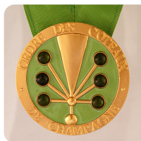
Dame Chevalier Chevalier

Diese Insignien übernehmen die Symbolik des Wappens: Das Pomponne-Glas, umgeben von Beeren, deren Farben sich dem Rang entsprechend unterscheiden und die an die Farbe von Trauben in unterschiedlichen Reifegraden erinnern.