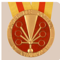
Dame Chambellan Chambellan